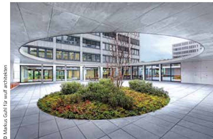
© Markus Guhl für wulf architekten

„Licht entfesselt. Die Vitalisierung eines gefangenen Raumes“ ¶ Ausstellung zur Generalsanierung des Stuttgarter Landtages ¶ www.derraumjournalist.net ¶ Raumbibliothek, Stuttgart