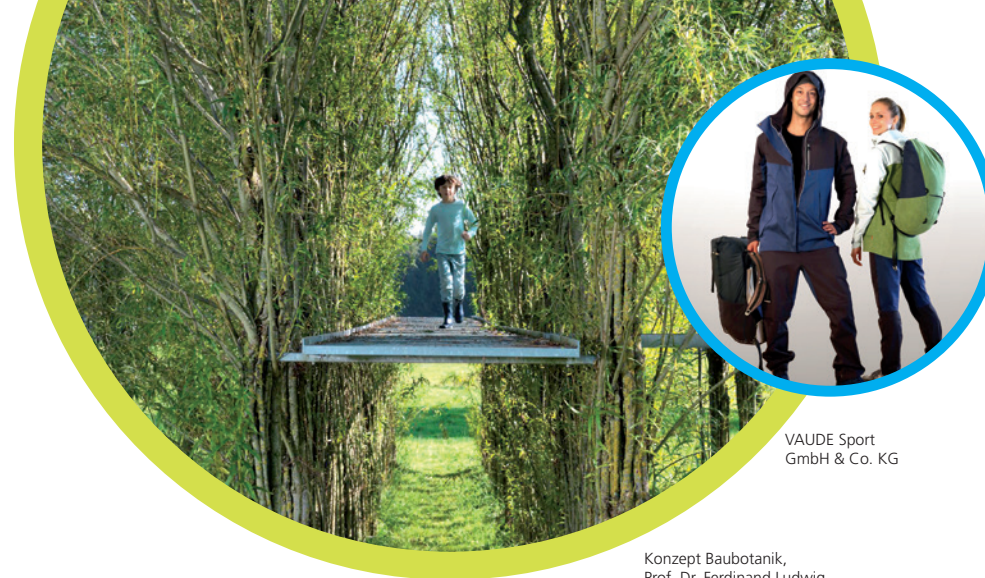
VAUDE Sport GmbH & Co. KG