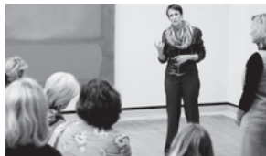
Freunde der Staatsgalerie Stuttgart

Wer mit einer Kunst- und Kultureinrichtung in der Region Freundschaft schließt, unterstützt die Kultur durch das finanzielle Engagement und profitiert gleichzeitig. Eine Mitgliedschaft bei den Freunden der Staatsgalerie Stuttgart umfasst neben dem freien Eintritt in die ständige Sammlung und in Sonderausstellungen ein exklusives Vermittlungsangebot mit Reisen, Führungen oder Seminaren. Ähnliche Vorteile genießen die Freunde der Galerie Stihl Waiblingen oder die Freunde der Kunsthalle Göppingen. Vor dem Hintergrund einer drohenden Schließung hat sich 1999 der Verein der Theaterfreunde der Württembergischen Landesbühne Esslingen gegründet, durch regelmäßige Aktivitäten ergänzt der Verein seither das Programm der WLB. Die Mitglieder des Württembergischen Kunstvereins sind Teil einer Gemeinschaft, die sich bei Eröffnungen, Festen, Workshops, Führungen, Künstlergesprächen, Reisen, beim Mitglieder-Jour Fixe und zu vielen anderen Anlässen trifft. Das Stadtmuseum Stuttgart in den historischen Mauern des Wilhelmispalais ist noch gar nicht eröffnet, die Stadtmuseumsfreunde unterstützen das künftige Museum bereits seit 2014.