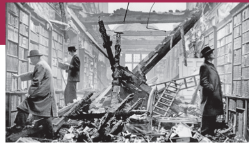
Johan Grimonprez, Blue Orchids (Blaue Orchideen), 2016, Holland House Library London, Historic England Archive 1940 Fox Photos

Thomas Borgmann, Stuttgarter Zeitung am 26. April 1997 über das 1. Medien-Meeting der WRS-MedienInitiative Region Stuttgart