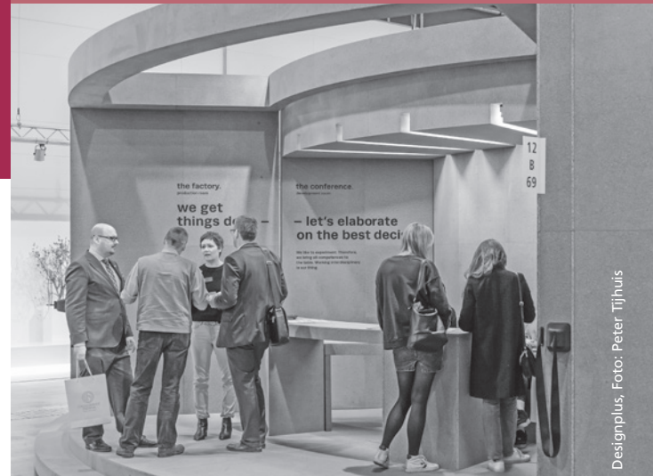
Designplus, Foto: Peter Tijhuis

Wie mit Beleuchtung und Beschallung ein Event passend inszeniert wird, zeigen die Veranstaltungstechniker von Music and Light Design aus Leonberg.