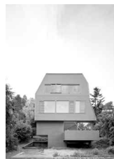
Einfamilienhaus „JustK“ AMUNT Architekten Hugo-Häring-Preisträger 2012

1903 wurde der Bund Deutscher Architekten BDA gegründet. Freiberuflich tätige Architektinnen und Architekten streben seit nunmehr 111 Jahren an, die Aufgaben und Inhalte der Architektur gegenüber des Qualitätsverlusts gebauter Umwelt gelten zu lassen. Inzwischen wird jeder dritte im Hochbau investierte Euro von einem BDA-Architekten geplant. Seit 1969 vergibt der Verband alle drei Jahre den Hugo-Häring-Preis an Architekten und Bauherren für ihr gemeinsames Werk. Bereits ab Februar erwartet der Landesverband Baden-Württemberg Bewerbungen für die erste Stufe des Auswahlverfahrens. Im Wechselraum, Zeppelin-Carré in Stuttgart, präsentiert der BDA Ausstellungen, Vorträge und Architekturgespräche. Der Raum dient der Darstellung der Arbeiten baden-württembergischer Architekten und Stadtplaner, der Präsentation wichtiger auch internationaler Projekte sowie der Kommunikation und dem baukulturellen Gedankenaustausch. Das Jahresprogramm 2014 ist veröffentlicht. www.bda-bawue.de , www.wechselraum.de