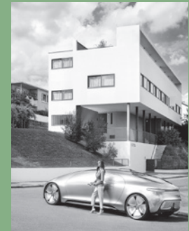
Foto links: Mercedes Classic Archive; Foto rechts: Wirtschaftsförderung Region Stuttgart GmbH (WRS)/Detlef Göckertz. Dieses Foto ist urheberrechtlich geschützt und darf nicht verbreitet oder vervielfältigt werden.