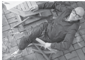
Goggo Gensch

„Das dokumentarische in all seinen Formen ist heute vielleicht wichtiger denn je. Die Unmittelbarkeit, die jeder dokumentarische Film innehat, verringert die Distanz zwischen Betrachter und Betrachtetem und ermöglicht so das Eintauchen in fremde Erfahrungswelten.“ So begründet SWR-Intendant Peter Boudgoust das neue SWR Doku Festival in Stuttgart.