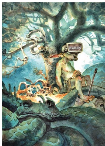
Illustration: Lukas Wind

Städte spielerisch zu entdecken, gelingt mit der App City Pro. Individuell auf die Reisenden abgestimmt, führen die Touren, angeleitet durch einen „Local“ oder eine animierte Figur, vorbei an Geschichte, Kultur oder Moderne. Personalisierte Drucksachen, wie Kalender oder Kochbücher mit ausgewählten Terminen oder Rezepten, ermöglichen Many Print Solutions. Ihnen gelingt es auch analog, Informationen durch kluge Algorithmen anzupassen. Dank des interaktiven Wimmelbuchs von Smile tauchen Kinder noch tiefer in Geschichten ein und werden durch die Figuren, denen sie bei ihren Problemen helfen, in ihrer emotionalen Entwicklung gefördert. Die Self-Publishing-Plattform Nextbook verknüpft klassische Verlagsdienstleistungen mit Crowdfunding. Das Team von Scriptbakery digitalisiert den gesamten Prozess der Annahme, Analyse und Verwaltung von Manuskripten. Auf www.mfg.de/ideentanke stellen sich die Teams im wöchentlichen Wechsel ausführlich vor.