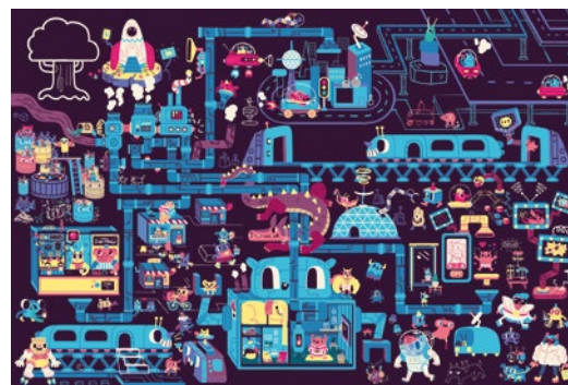
S.M.I.L.E. | Filmakademie Baden-Württemberg | Producer: Daniela Drewke, Michael Schrammer Illustration: Jasmin Dreyer | Regie: Daniel Bahr | Konzept: Lukas Kanwan

Verlagen und dem Buchhandel neue Impulse verschaffen, darum geht es bei dem Wettbewerb Ideentanke. Zum vierten Mal bringen die WRS, die MFG Baden-Württemberg und weitere Partner Kreative aus dem Südwesten auf die Frankfurter Buchmesse. Am Stand 3.1 H15 pitchten fünf Teams vom 16. bis 19. Oktober ihre Ideen. Der Feedback-Sunday öffnet die Bühne für alle Interessierten, die sich Feedback zu ihren Ideen einholen wollen. Bewerben bei www.mfg.de/va/feedbacksunday