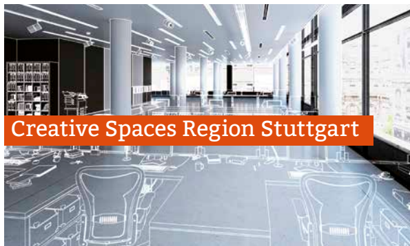
Creative Spaces Region Stuttgart

kreativ.region-stuttgart.de film.region-stuttgart.de popbuero.region-stuttgart.de