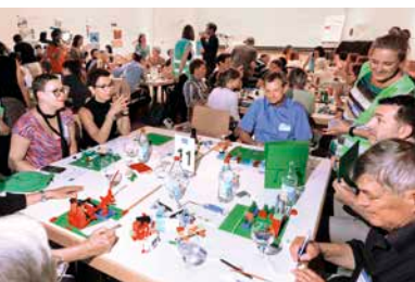
Medien-Meeting 2016

Zentrales Projekt für die gesamte Region ist natürlich die Internationale Bauausstellung 2027 StadtRegion Stuttgart (IBA'27). Hier wird über das Arbeiten und Leben in der Zukunft verhandelt. Zum 100-jährigen Jubiläum der Weissenhofsiedlung in Stuttgart möchte die IBA'27 mit einem Ideenwettbewerb städtebauliche Potenziale des Weltkulturerbes identifizieren. Die Ergebnisse werden vom 29. Juni bis 1. Juli auf dem Weissenhof vorgestellt und diskutiert und gefeiert: Das Erbe der Moderne. IBA'27-Plenum, Baukulturwerkstatt und internationales IGMA-Symposium